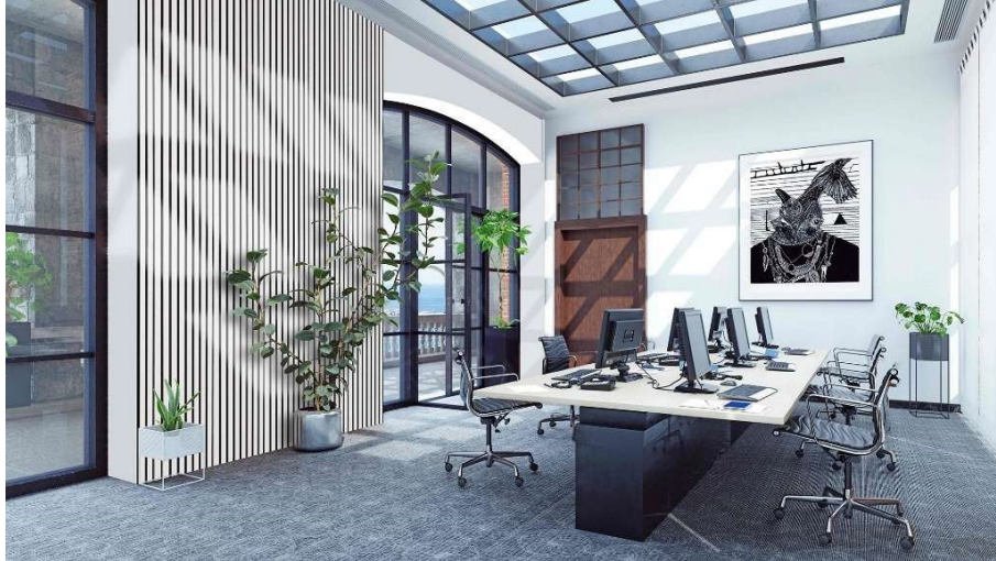
Oficina acondicionada acústica y decorativamente con Greenpet Basic en Concesur (Sevilla).