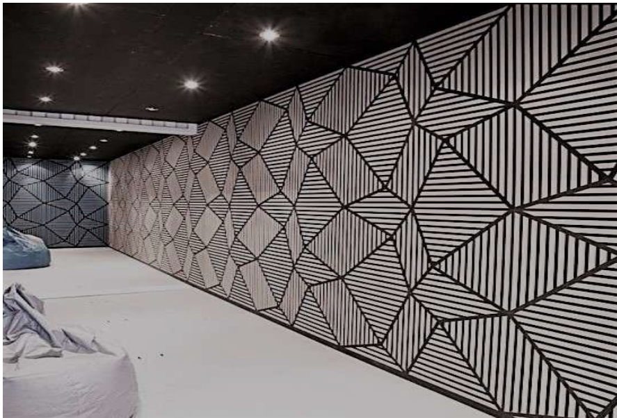
Mural decorativo a base de Greenpet Basic .

La fibra de PET, cuando se expuso a un ambiente de 50 °C y con una humedad relativa del 90 % durante cuatro días, mostró una absorción de humedad de menos del 0,03 % en peso. Las fibras de PET no son afectadas por la humedad, el moho y no se pudren o deterioran en situaciones de uso previstas.