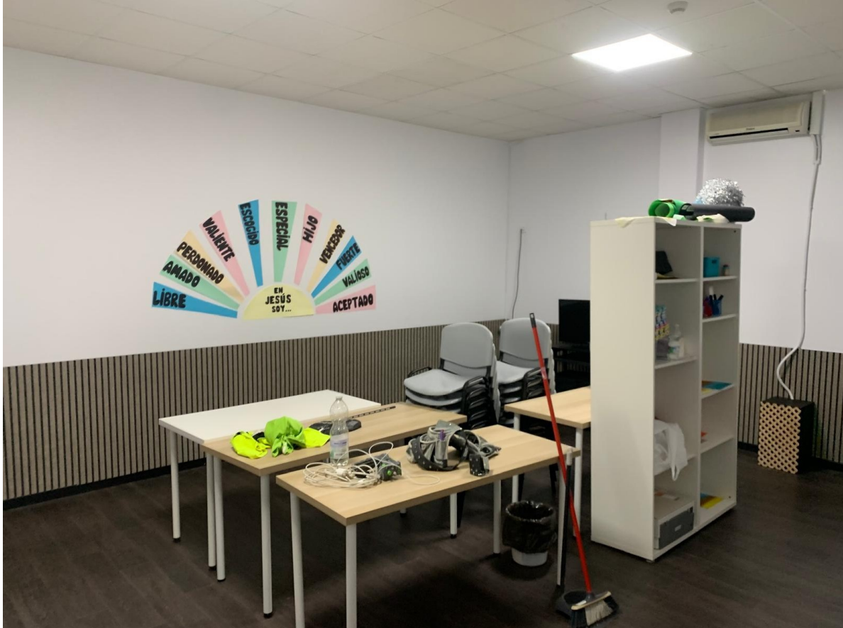
Revestimiento pared Iglesia Evangélica). Jerez Fra. Cádiz

Quitar el polvo y pasar la aspiradora periódicamente ayuda a mantener el aspecto del panel. Quite el polvo con un paño suave. Cuando pase la aspiradora, use la función de succión baja y un accesorio de cepillo suave.