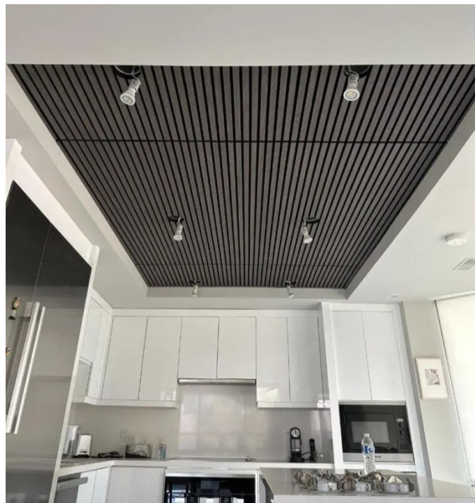
Techo decorativo a base de Greenpet Basic .

La fibra de PET, cuando se expuso a un ambiente de 50 °C y con una humedad relativa del 90 % durante cuatro días, mostró una absorción de humedad de menos del 0,03 % en peso. Las fibras de PET no son afectadas por la humedad, el moho y no se pudren o deterioran en situaciones de uso previstas.