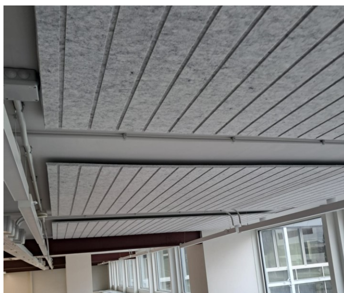
Greenpet 501. Universidad Planeta. Madrid

Los paneles Greenpet 501 han sido diseñados para revestimiento de paredes, fabricación de mamparas, separadores e incluso, como paneles acústicos, con el fin de crear espacios atrayentes y confortables. El tacto suave, el diseño y su calidad les confieren una singularidad propia.